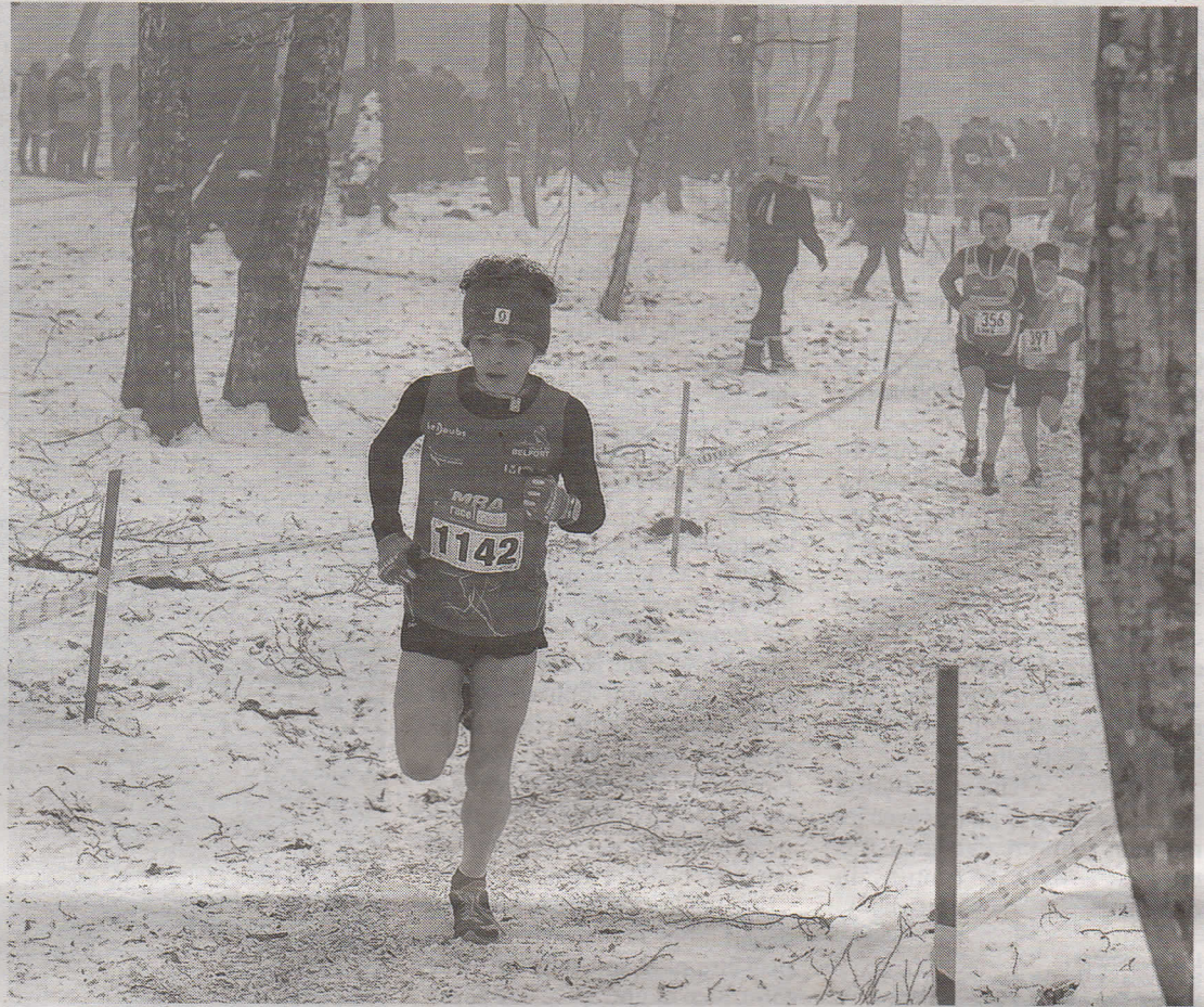
Malgré la neige, le froid et le brouillard, près de 950 athlètes, de benjamins à Masters, ont terminé les premiers championnats de Bourgogne-Franche-Comté de cross-country.